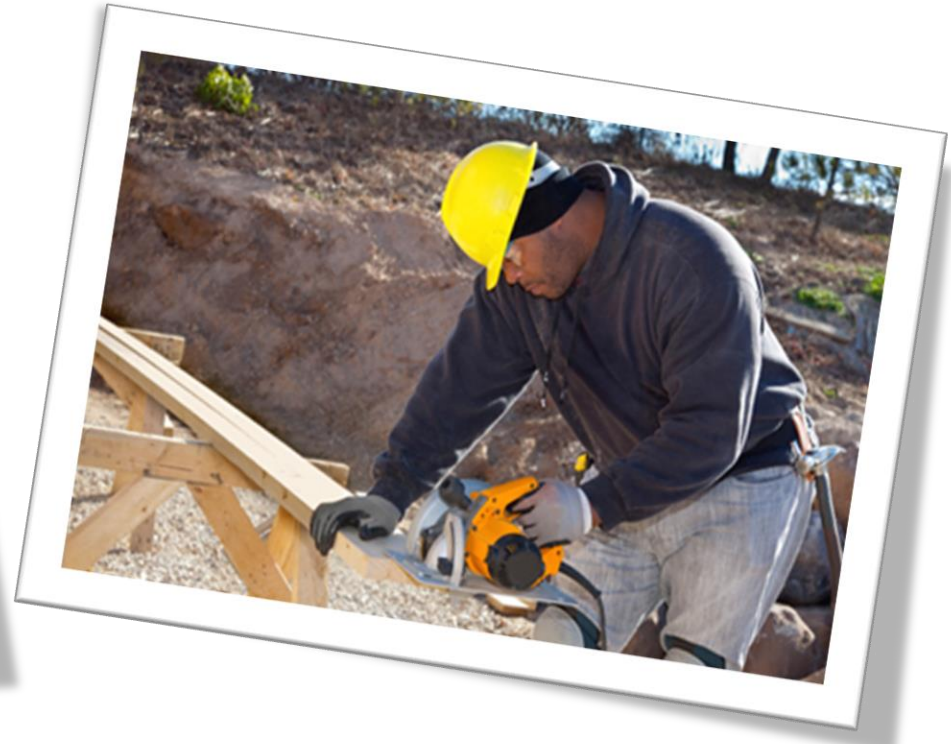
Renovations and repairs / Rénovations et réparations