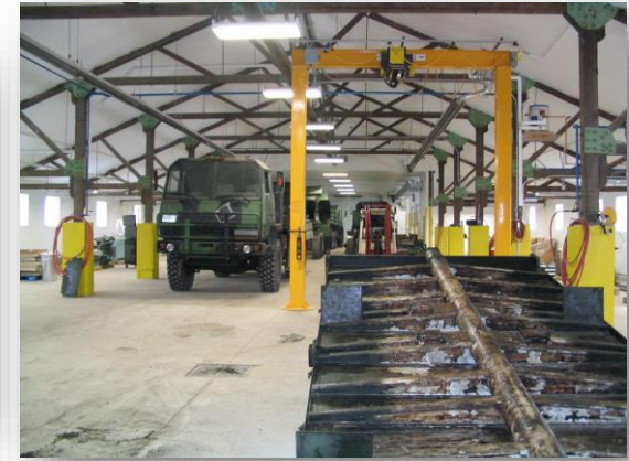
Vehicle Reburbishment / remise à neuf des véhicules