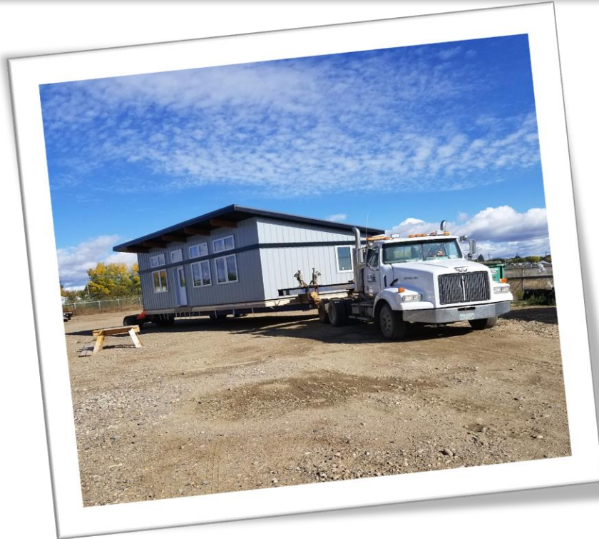
Houses, Buildings, Kennels & More / Maison, bâtiment, chenils et plus!