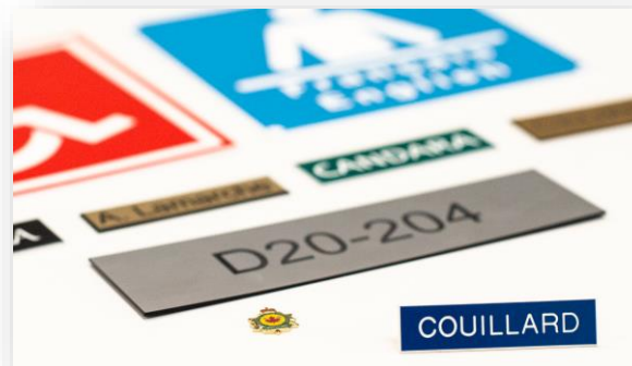
Printing and engraving/ Imprimerie et impression